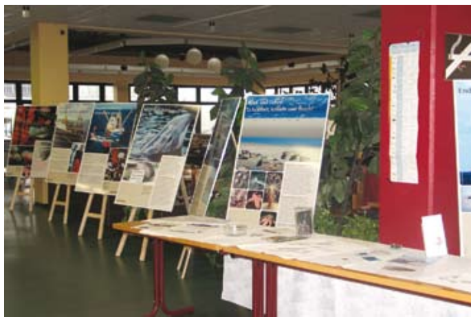
Anlässlich der vollständigen Umstellung unseres Fischangebots auf Fisch aus nachhaltiger Fischerei oder Öko-Aquakulturen haben wir gemeinsam mit Greenpeace Ausstellungen zur Überfischung der Weltmeere organisiert.

versüßen, ist die räumliche Integration und Nähe eine sinnhafte Innovation. Die vorgehaltenen erweiterten Serviceangebote sollen dazu führen, dass Studierende die Einrichtungen des Studentenwerks als ihren Hochschultreffpunkt sehen und annehmen.