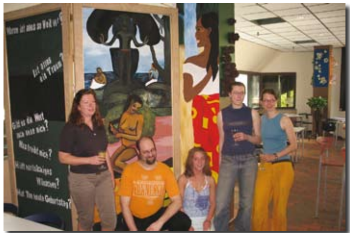
In Zusammenarbeit mit einer studentischen Gruppe des Fachbereichs Kunst der Universität wurde in der Cafeteria eine neue VitaminBar eingerichtet und gestaltet.

Eventstationen sind nämlich „in“. Nach dem erfolgreichen Start des Culinarium am Uhlhornsweg wurden an weiteren Standorten attraktive Salatbars errichtet, die sich hoher Beliebtheit erfreuen. Frische und Naturbelassenheit zeichnen auch die Produkte der VitaminBar aus, die in den renovierten und zum Teil von Studierenden des Fachbereichs Kunst der Universität mitgestalteten Gasträume der Cafeteria Uhlhornsweg verkauft werden. Zusätzlich zur Renovierung der Gasträume wurde dort eine Station geschaffen, die ausschließlich frisch gepresste Säfte anbietet. Nun könnte man über eine DessertBar nachdenken, denn Desserts werden zurzeit so stark nachgefragt wie nie.