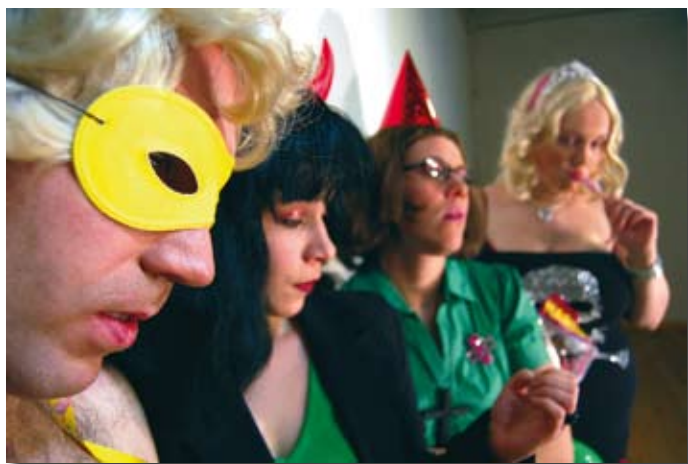
Eine von vier Uraufführungen im OUT war „I love my job“ von Regisseur Ekart Cordes, der jetzt zum Staatstheater gewechselt ist

Semesterübergreifende Workshops im letzten Jahr waren der „Theatersport“ (in Kooperation mit dem Sportbereich) und die „Theaterwerkstatt“. Diese waren