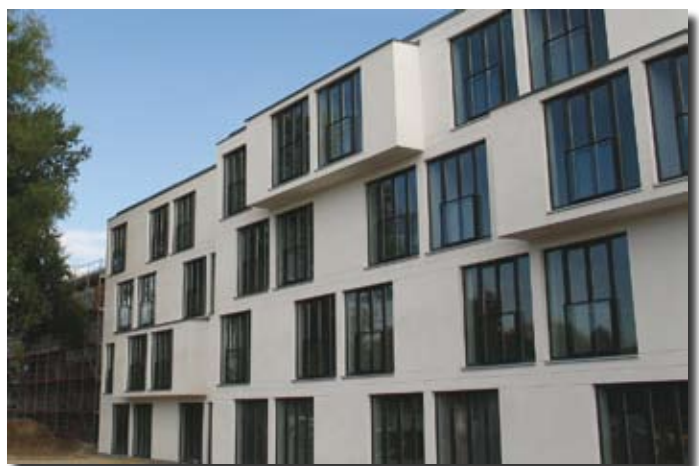
Haus 1 der „Campus Appartements“ ist fast fertig