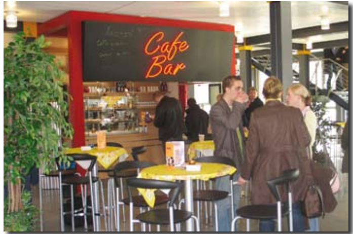
Erfolgreiches Konzept: Auch in der Mensa Emden gibt es jetzt eine CaféBar.

Es bleibt also ein wirtschaftliches Problem zu lösen, das nicht nur durch Drehen an den betriebswirtschaftlichen Stellschrauben zu beheben ist. Als wesentliches Moment ist die Erhöhung der Auslastung anzusehen, um die fixen Kosten in ein erträgliches Maß zu bugsieren. Nur leider ist die potentielle Nachfrage von studentischer Seite nicht hoch genug, um das zu bewerkstelligen. Gesucht wird eine erweiterte Nutzungskonzeption, um die finanziellen Nöte der Einrichtung zu lindern.