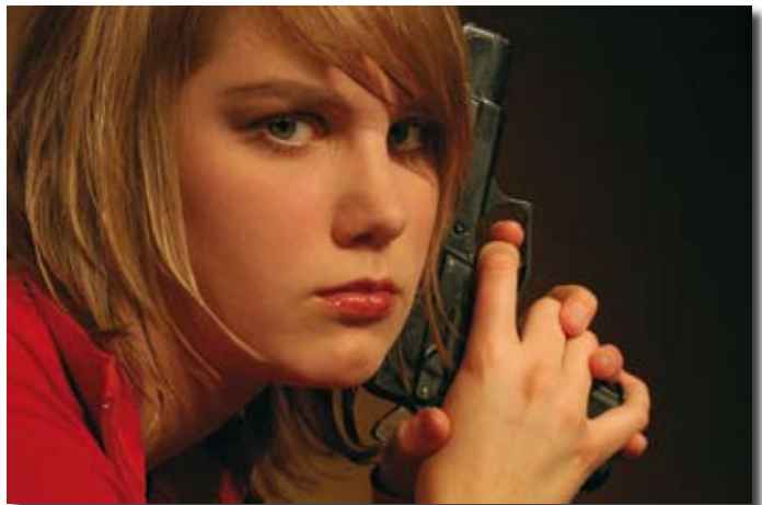
Bild aus der Aufführung der erfolgreichen Produktion „Schwarze Mamba“, die im November 2006 Premiere hatte

Die OUT-Theaternacht „OUT all night“ wurde in diesem Jahr zum dritten und die „Dickens Weihnachtsgeschichte“ bereits zum siebten Mal gestaltet. Beide Veranstaltungen haben sich wie in den letzten Jahren bewährt, da sie viel neues Publikum in die Räume des Unikum bringen. Daneben gab es weiterhin sehr gut besuchte regelmäßige Auftritte der Improvisationsgruppen „12 Meter Hase“ und „Wat Ihr Wollt“.