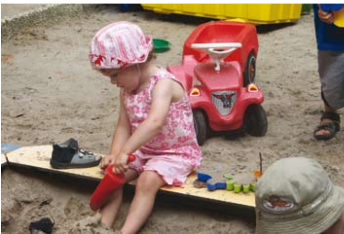
Spiel im Sandkasten in der Kindertagesstätte Constantia in Emden

Mit der Bereitstellung von Kinderbetreuungs-einrichtungen im hochschulnahen Bereich unterstützt das Studentenwerk Oldenburg studentische Eltern schon seit Jahren. Wir unterhalten Kindertagesstätten in Oldenburg und Emden und helfen so Studierenden, Studium und Kindererziehung unter einen Hut zu bringen.