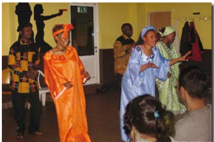
Eine Kultur Nacht in der Wohnanlage Schützenweg

In unregelmäßigen Abständen werden Themenwochen zu bestimmten Weltregionen veranstaltet, die auf vielen Ebenen zur Beschäftigung mit der Region anregen soll. So fand im Sommersemester 2006 eine Asiatische Woche mit zahlreichen Veranstaltungen statt.