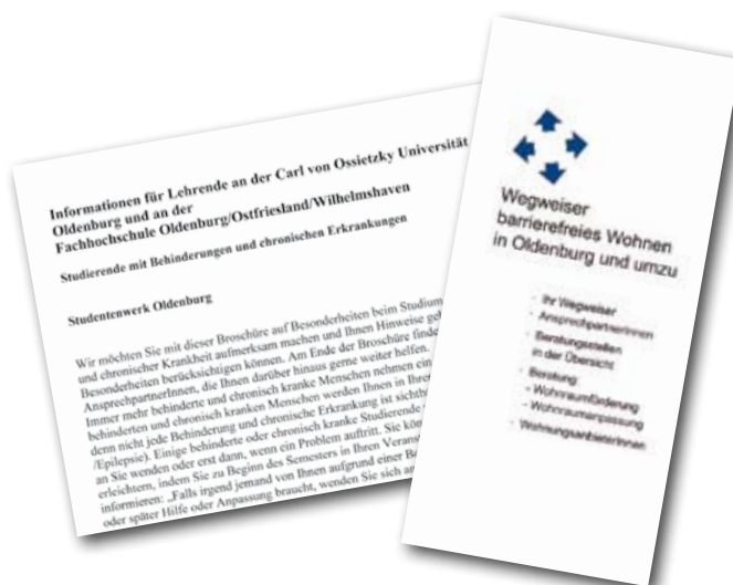
Einige der Broschüren, die im vergangenen Jahr von der Behindertenberaterin erstellt wurden.

Für Ratsuchende mit Behinderungen oder chronischen Erkrankungen hat das BeratungsCenter viele Vorteile